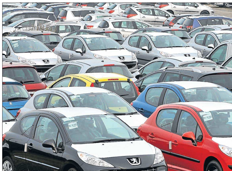
Peugeot will mit der neuen Kooperation wieder vorne mitmischen.

Die beiden Unternehmen gehen davon aus, dass nach rund fünf Jahren im Rahmen der Allianz Synergien in Höhe von ungefähr zwei Milliarden US Dollar (1,5 Milliarden Euro) pro Jahr entstehen.